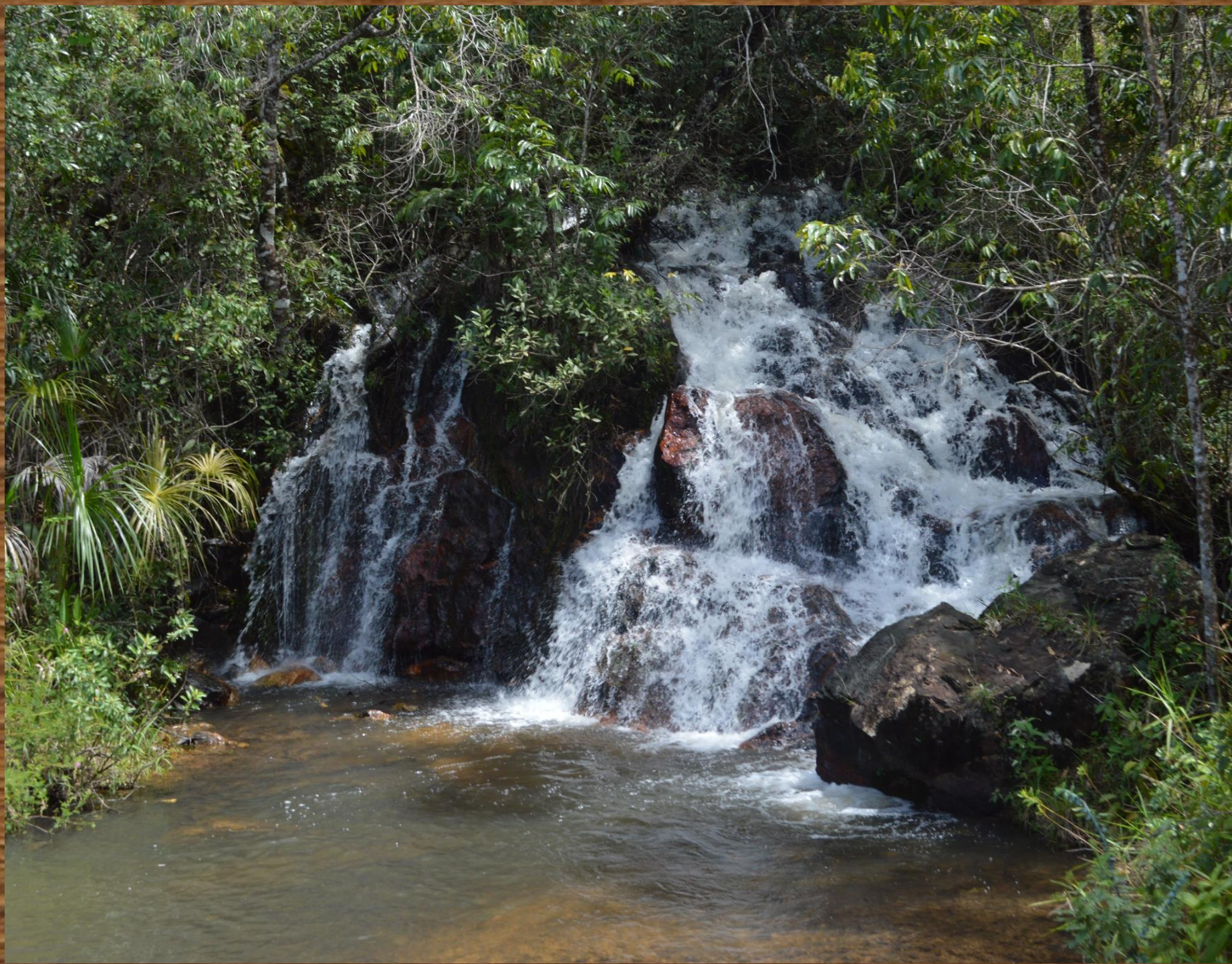
Córrego do Meio, localizada em propriedade particular.