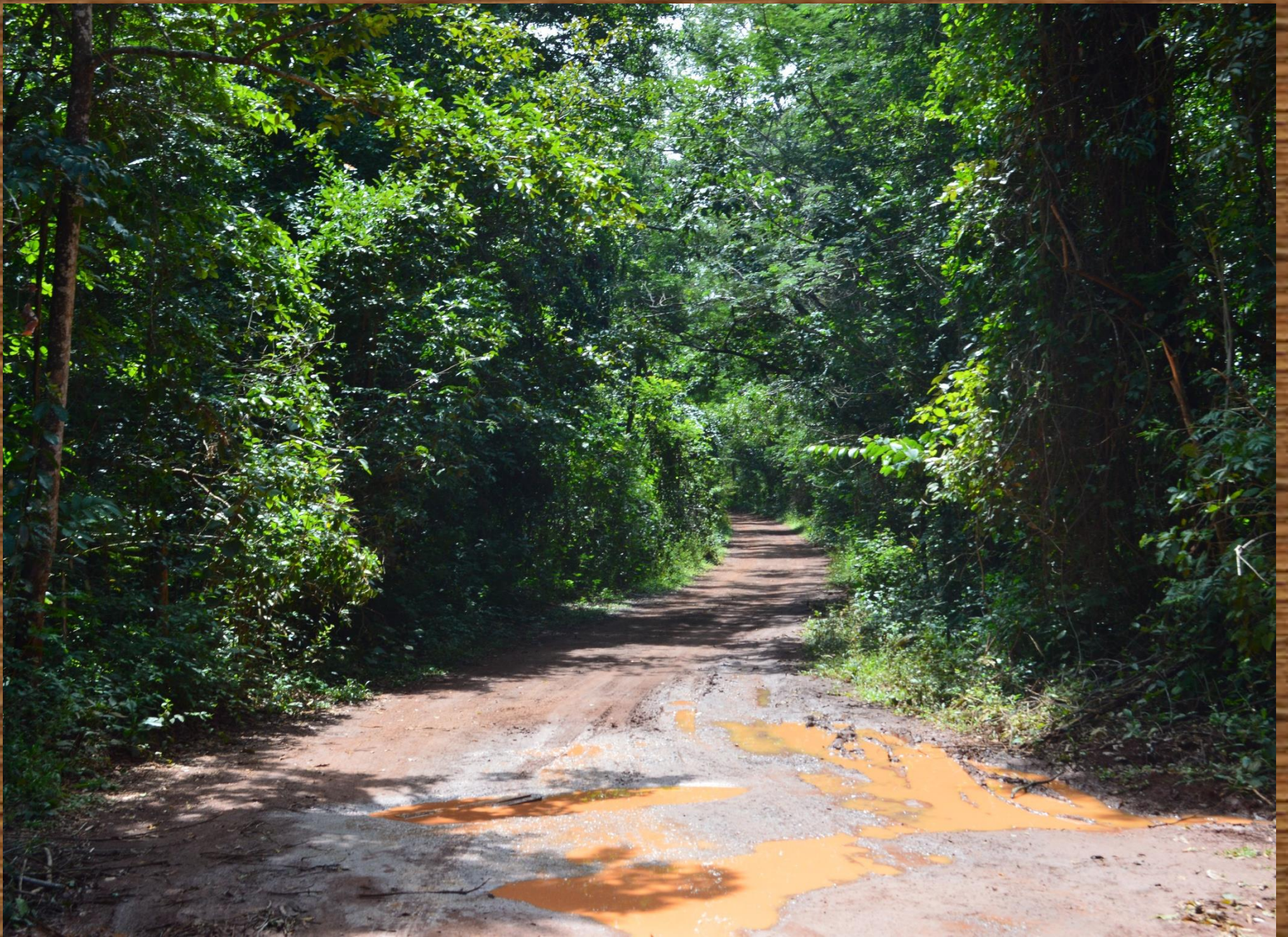
Trecho da estrada que dá acesso à cachoeira, quase todo, sob a sombras das árvores do Núcleo Rural Córrego do Meio.