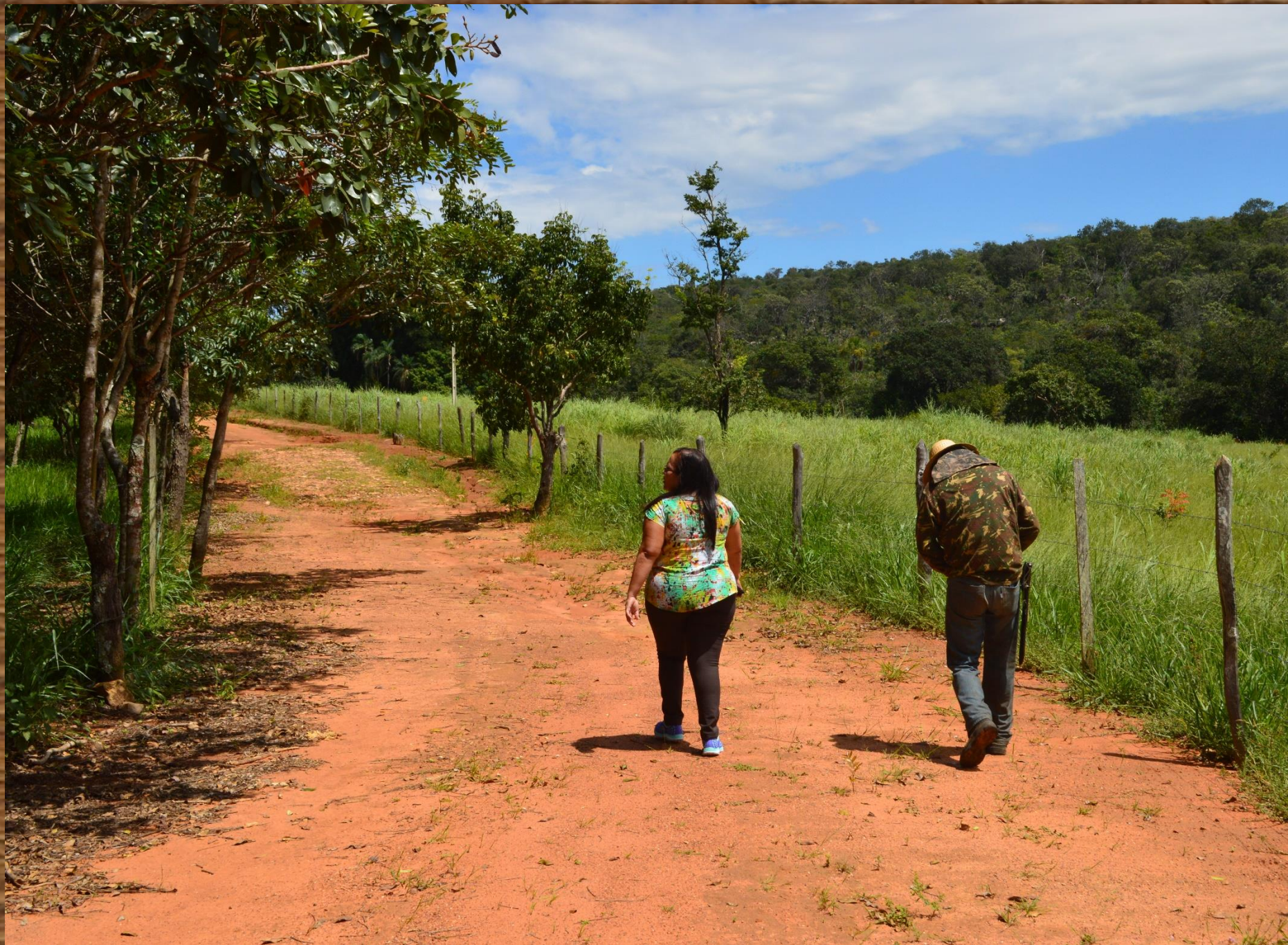
Trecho da estrada que dá acesso à cachoeira.